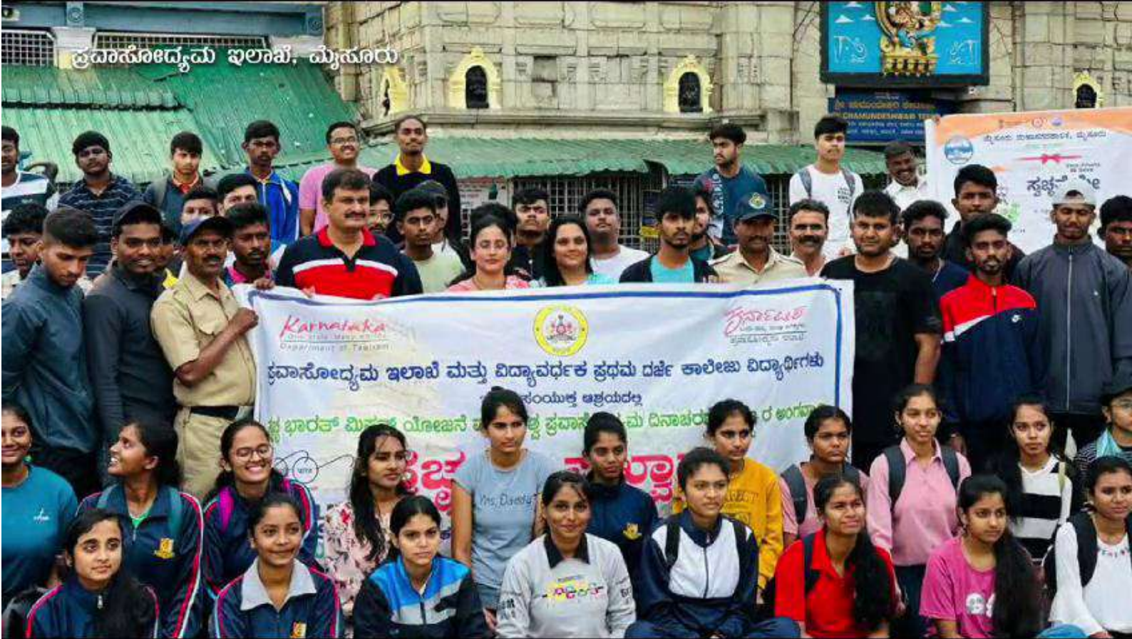
ಪ್ರವಾಸೋದ್ಯಮ ಇಲಾಖೆ, ಮೈಸೂರು

Karnataka One State Many Cultures Department of Tourism ಪ್ರವಾಸೋದ್ಯಮ ಇಲಾಖೆ ಮತ್ತು ವಿದ್ಯಾವರ್ಧಕ ಪ್ರಥಮ ದರ್ಜೆ ಕಾಲೇಜು ವಿದ್ಯಾರ್ಥಿಗಳು ಸಂಯುಕ್ತ ಆಶ್ರಯದಲ್ಲಿ ಪ್ರಭಾರತ್ ಮಿಷನ್ ಯೋಜನೆ ಅಡಿಯಲ್ಲಿ ಪ್ರವಾಸೋದ್ಯಮ ದಿನಾಚರಣೆ ಕಾರ್ಯಕ್ರಮದ ಅಂಗವಾಗಿ ಪ್ರವಾಸೋದ್ಯಮ ಇಲಾಖೆ ಮೈಸೂರು