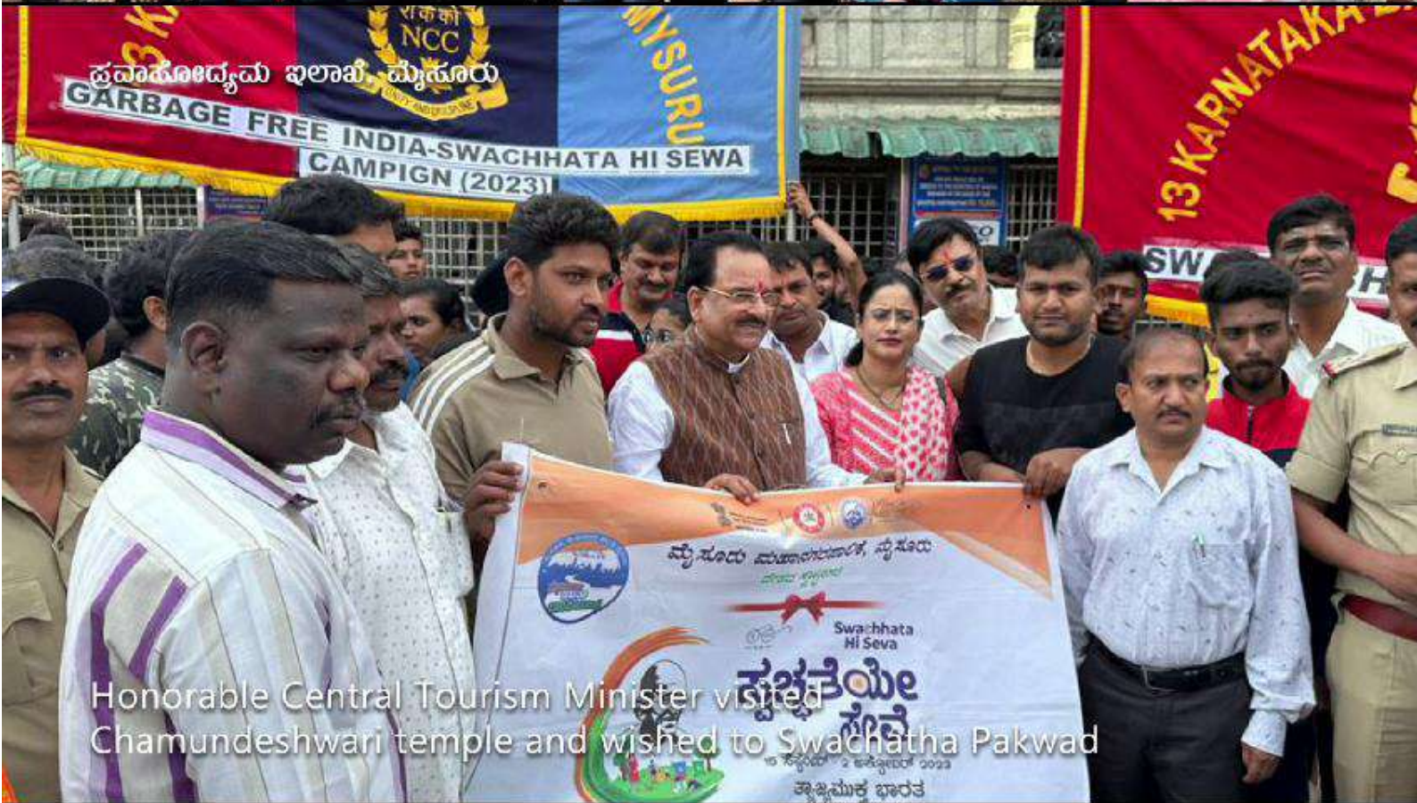
Honorable Central Tourism Minister visited Chamundeshwari temple and wished to Swachhata Pakwad