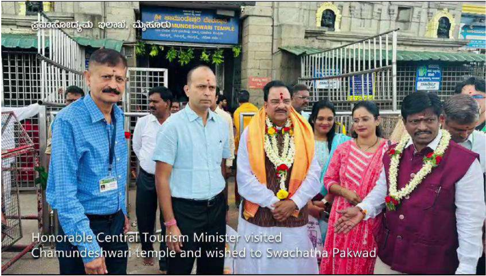
Honorable Central Tourism Minister visited Chamundeshwari temple and wished to Swachatha Pakwad