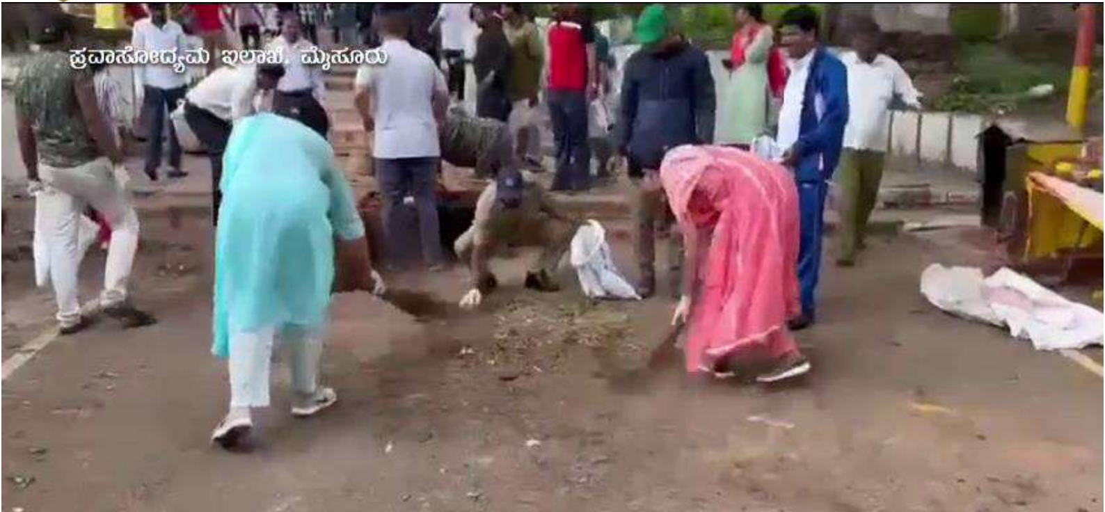
ಪ್ರವಾಸೋದ್ಯಮ ಇಲಾಖೆ, ಮೈಸೂರು