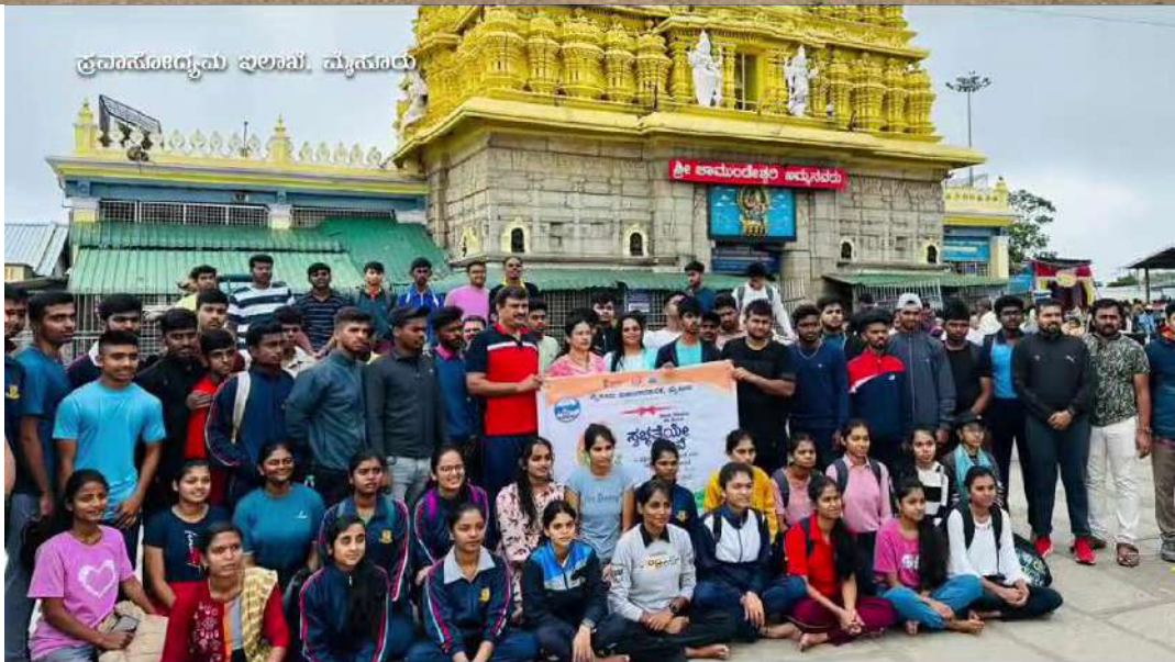
ಪ್ರವಾಸೋದ್ಯಮ ಇಲಾಖೆ, ಮೈಸೂರು